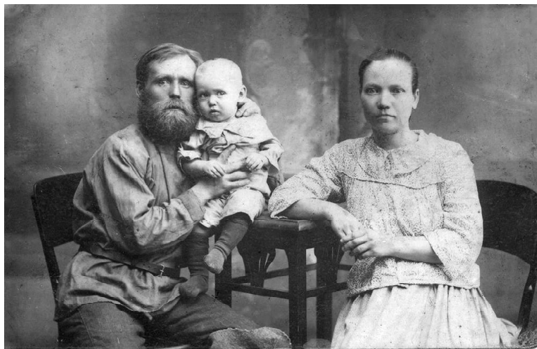
1905 год, Филиппу 1 год.

Подготовила к публикации Наталья ЛИХАЧЕВА.